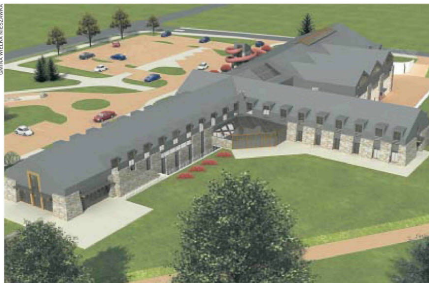
Bryła jest surowa, ale obiekt ma walory estetyczne, które będą go wyróżniać. I doskonale wkomponuje się w otoczenie

W graniczącej z Toruniem Wielkiej Nieszawce rozpoczęła się budowa aquaparku za 35 mln zł. Będzie to najnowocześniejszy tego typu obiekt w regionie kujawsko-pomorskim